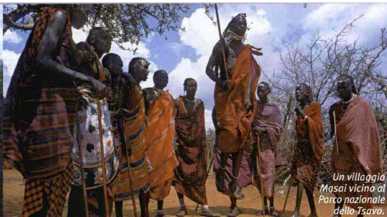
Un villaggio Masai vicino al Parco nazionale dello Tsavo.