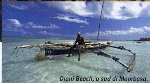
Diani Beach, a sud di Mombasa.