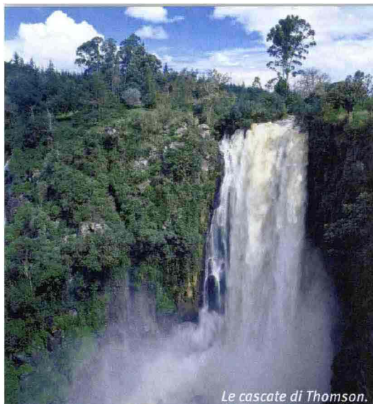
Le cascate di Thomson.